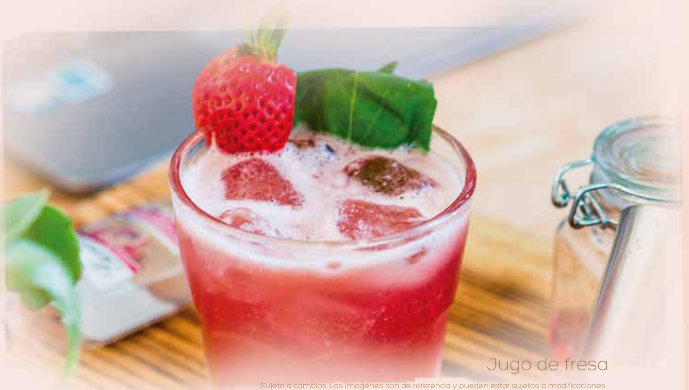
Jugo de fresa

Sujeto a cambios. Las imágenes son de referencia y pueden estar sujetos a modificaciones